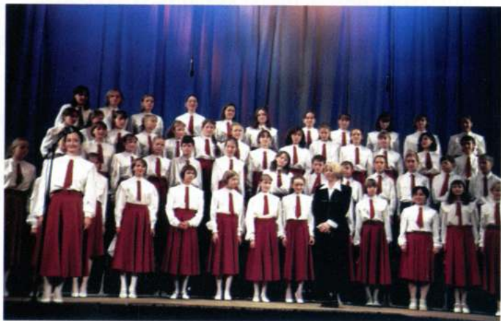
CHILDREN'S CHOIR PODLIPKI (Korolyov - Rússia)