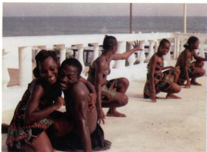
DZA NYONMO DANCE ENSEMBLE (Accra - Ghana)