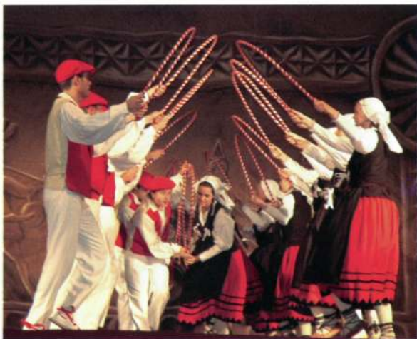
ALKARTASUNA EUSKAL DANTZA TALDEA (Pasai Antxo - Guipúscoa)