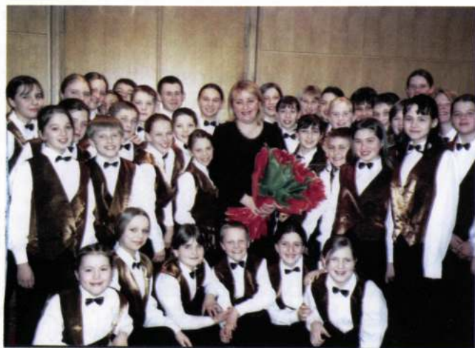
«AEDA» CHILDREN'S CHOIR (Uman - Ucraina)