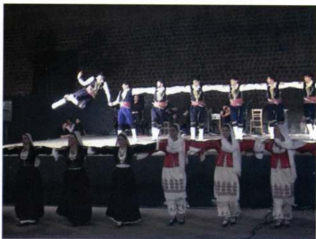
TRADITION FOLKLORE ASSOCIATION OF CHANIA (Chania - Grècia)