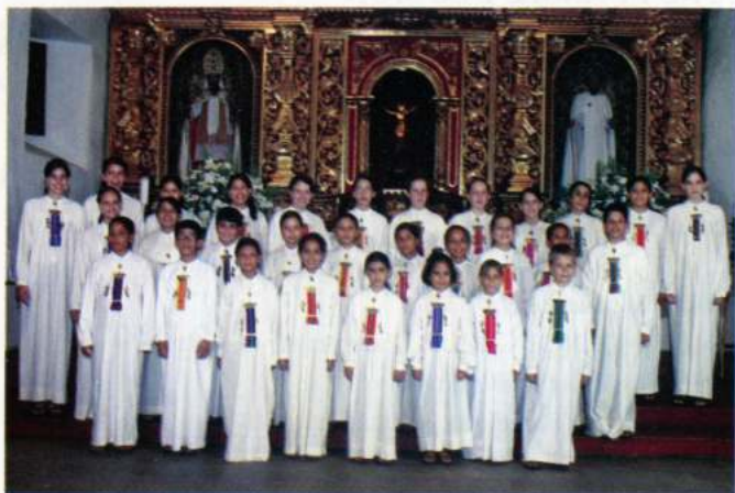
JUGLARES ESCOLANÍA DE CALI (Cali - Colòmbia)