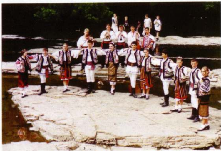
FOLK DANCE GROUP IZVORASUL (Cluj-Napoca - Romania)