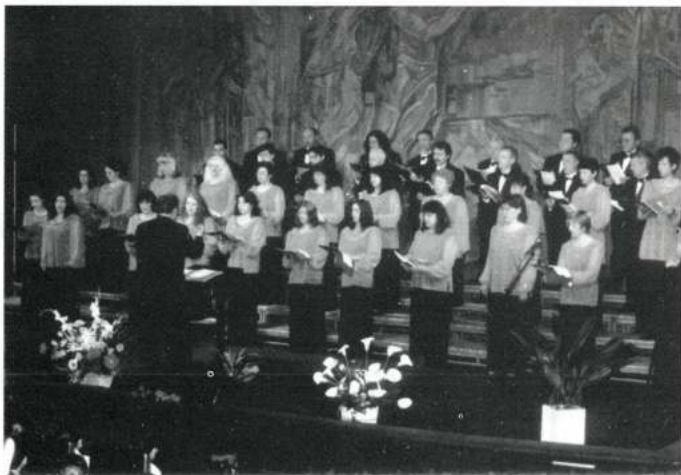
DOBRI CHINTULOV MIXED CHOIR (Sliven - Bulgària)

- When the first classified groups score the same number of points, the prizes in cash will be divided proportionally and the trophies will be given to all those who share the position.