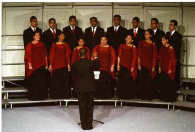
CORAL ANTIPHONA (Maracaibo - Venecuèla)