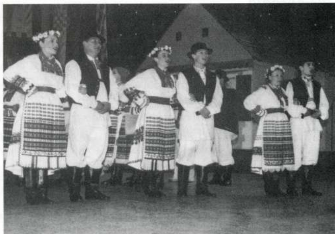
KUD «KUPLJENOVO» (Zapresic - Croàcia)