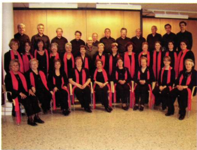
CORAL ARIADNA (La Garriga - Catalunya)