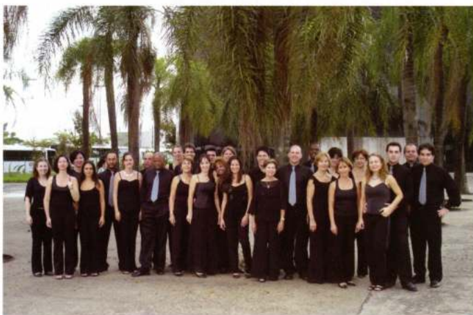
MADRIGAL VIVACE (Jundiaí - Brasil)