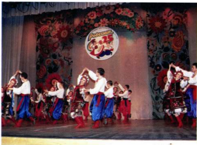
«ROVESNIK» (Dniepropetrovsk - Ucraina)