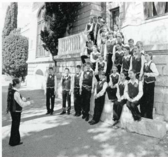
CHILDREN'S CHOIR «KAMERTON» (Krasnoyarsk - Rússia)