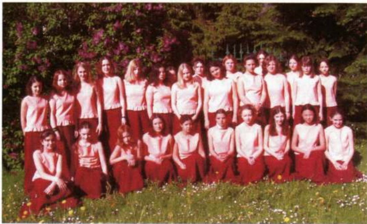
CERVÁNEK CHILDREN'S CHOIR (Cerveny Kostelec - Rep.Txeca)