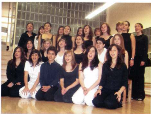
COR CORAL·LÍ (Barcelona - Catalunya)