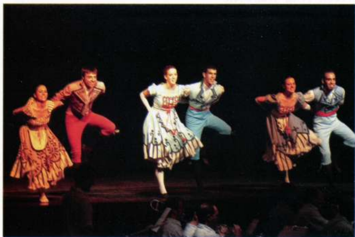
GRUP MEDITERRÀNIA (Sant Cugat - Catalunya)