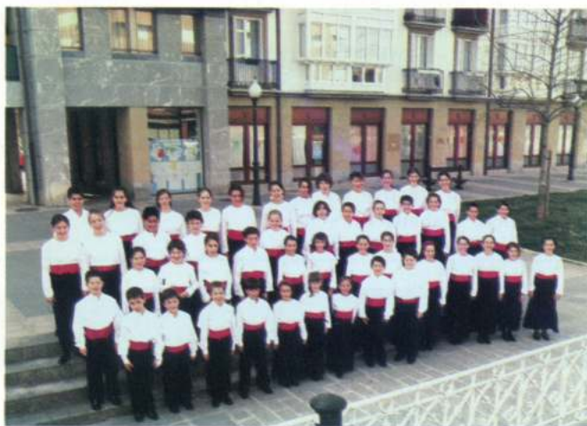
CORO INFANTIL AMETSA (Irún - Euskadi)