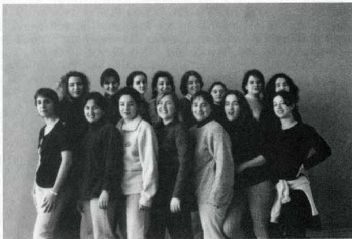
» «XOLO» VOCES BLANCAS (Molina de Segura -Múrcia)