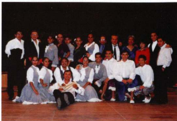
GRUPO DE DANZAS TRUJILLO MÍO (Trujillo - Perú)