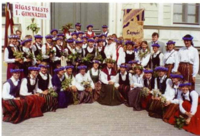
«SAPNIS» FEMALE CHOIR (Riga - Letõnia)