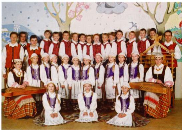
PYNIMELIS DANCE GROUP (Panevezys - Lituània)