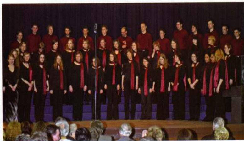
APZ MARIBOR ACADEMIC CHOIR (Maribor - Eslovènia)