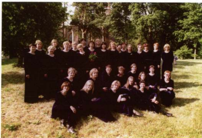
WOMEN CHOIR «LIEPOS» (Vilnius - Lituània)