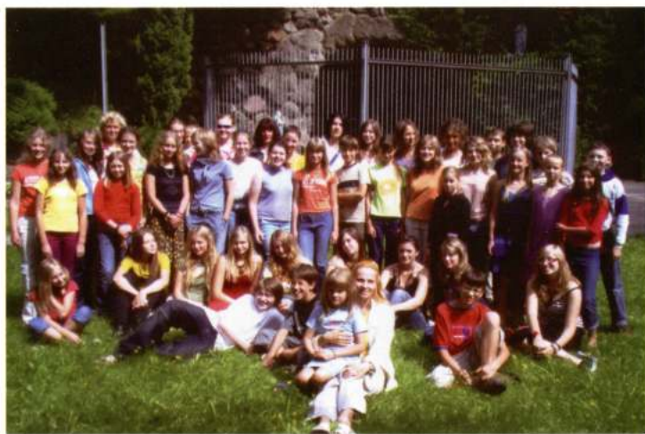
CHOIR SV. PRANCISKAUS PAUKSTELIAI (Vilnius - Lituània)