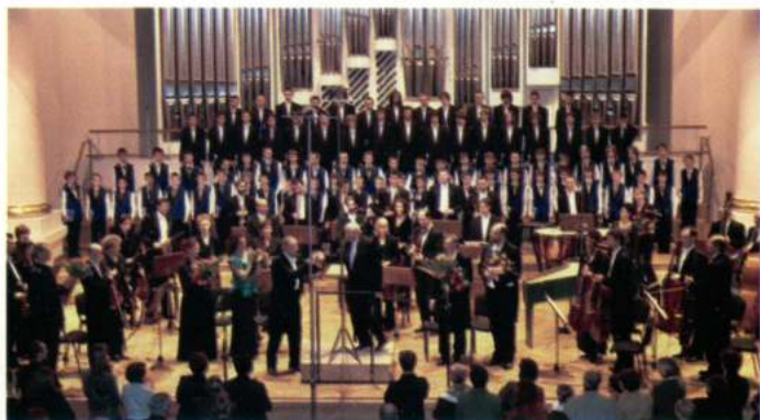
THE BOY'S CHOIR SANCTI NICOLAI (Bochnia - Polònia)