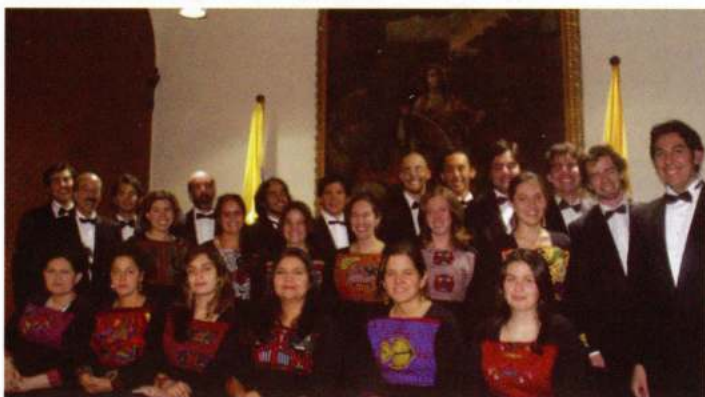
CORO DE LA UNIVERSIDAD DE LOS ANDES (Bogotá - Colòmbia)