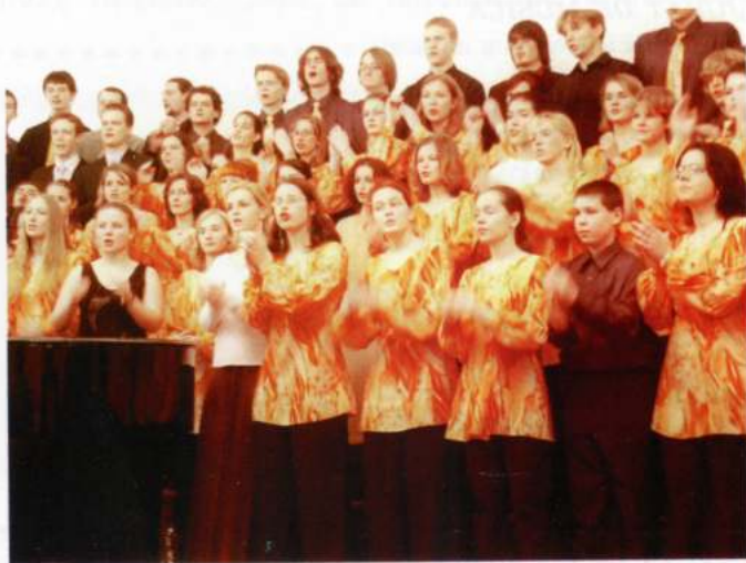
LUSCINIA MIXED CHOIR (Opava - Rep.Txeca)