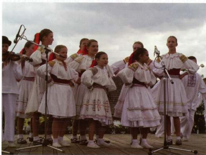
FIALKA CHILDREN DANCE GROUP (Partizanske - Eslovàquia)