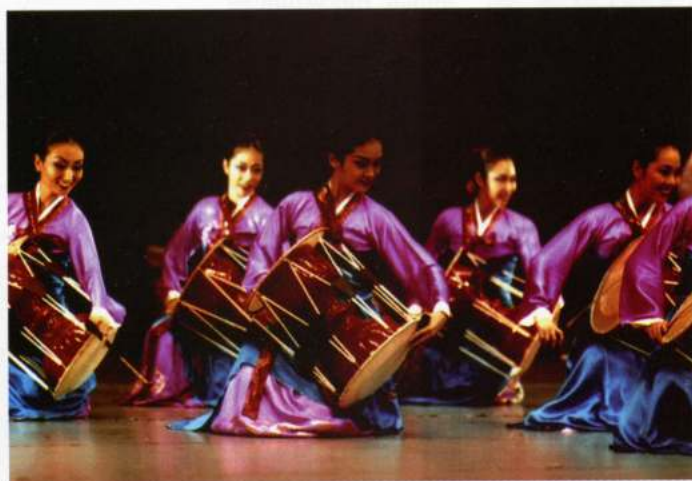
INCHEON ARTS HIGH SCHOOL (Seoul - Korea)