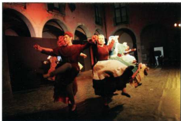
ESBART DANSAIRE DE CASTELLÓ D'EMPÚRIES (Castelló d'Empúries - Catalunya)