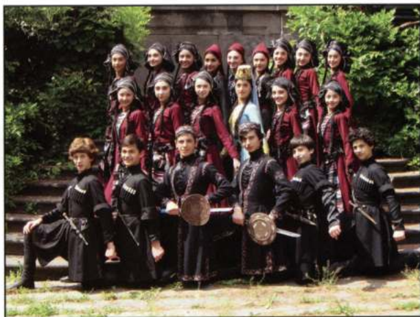
FOLK DANCE GROUP «IMEDI» (Tbilisi - Geòrgia)