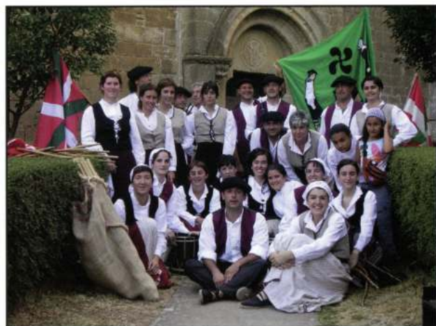
BALDORBA DANTZA TALDEA (Burlada - Navarra)