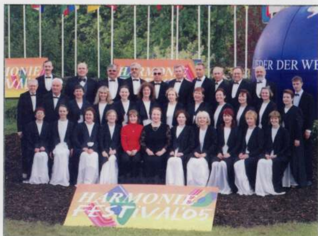
MINSK CHOIR ACADEMY (Minsk - Bielorrússia)