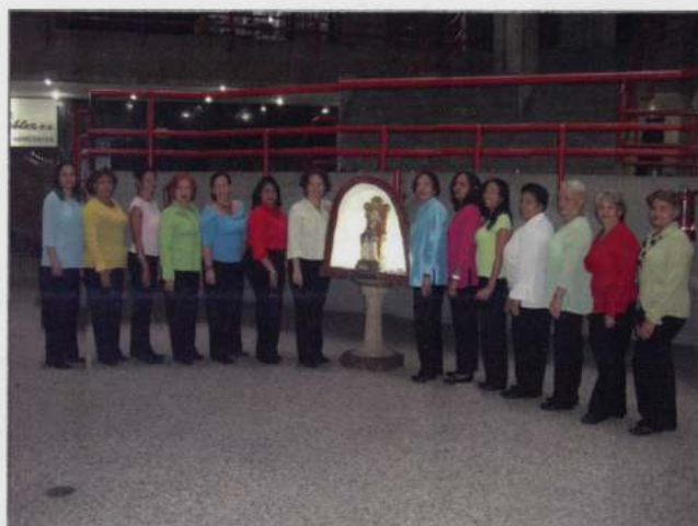
CÁNTALO GRUPO VOCAL FEMENINO (Caracas - Venezuela)