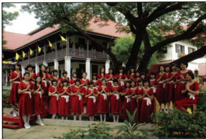
WATTANA GIRL'S CHOIR (Bangkok - Tailàndia)