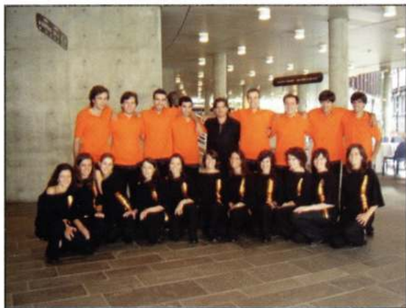
ENSEMBLE VOCAL FREAMUNDE (Paços de Ferreira - Portugal)