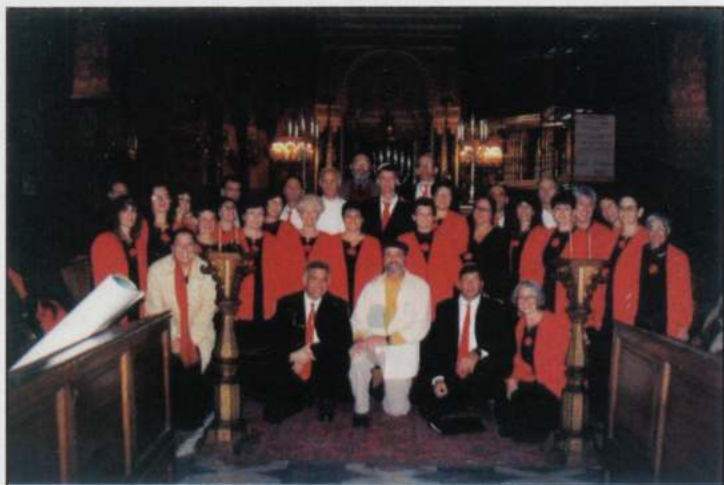
THE UPPER GALILEE CHOIR (Alta Galilea- Israel)