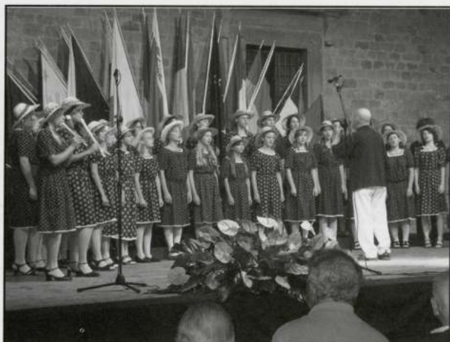
JITRENKA (Ceské Budejovice - Rep. Txeca)