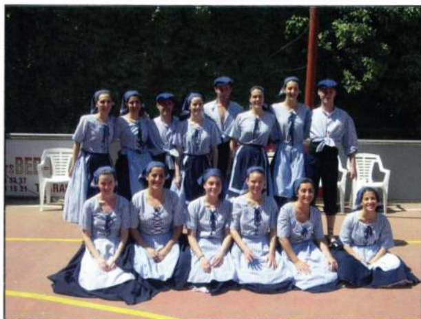
ESBART EGARENC (Terrassa - Catalunya)