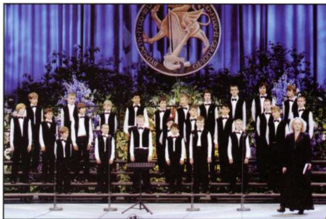
BOY'S CHOIR «ISKRA» (St.Petersburg - Rússia)