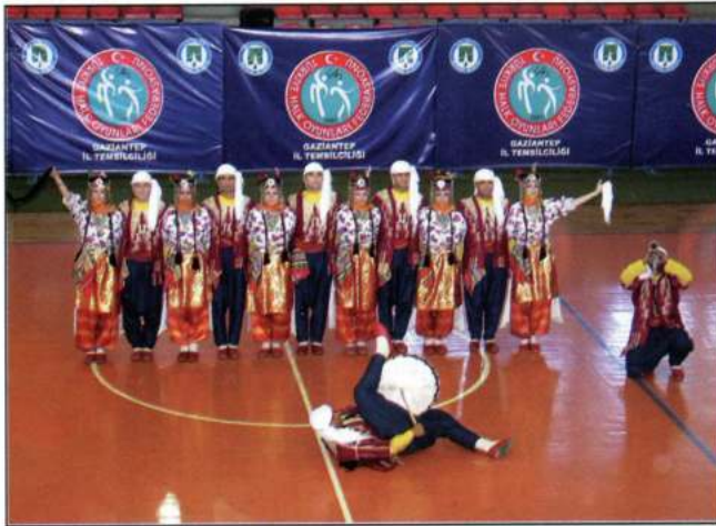
OZEL ÇAĞDAS BILGI OKULLARI (Gaziantep - Turquia)