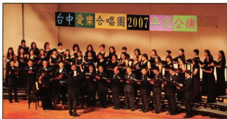
TAICHUNG PHILHARMONIC CHOIR (Taichung - Taiwan)