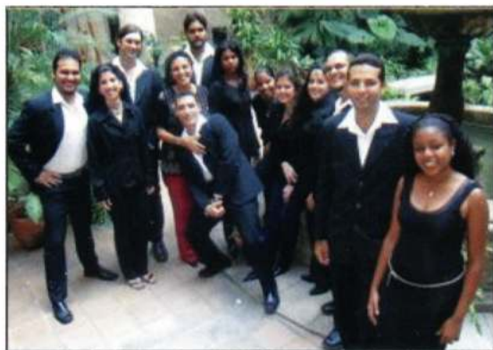
CORO DE CÁMARA «VOCAL LEO» (L'Havana - Cuba)