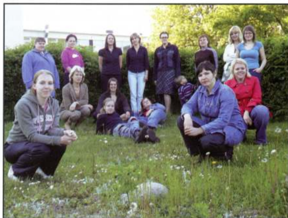
CON SPIRITO (Tartu - Estònia)