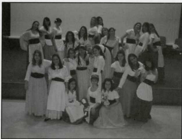
CORO FEMINILE EOS (Roma - Itàlia)