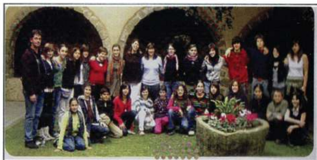
COR CLAUDEFAULA (Girona - Catalunya)