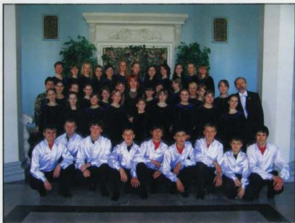
SHKOLNYE GODY (Simferopol - Ucraina)