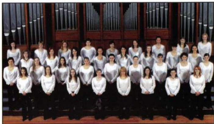
AURIN FEMALE CHOIR (Kecskémét - Hongria)