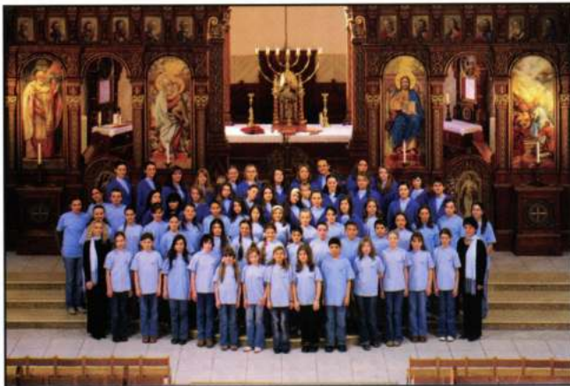
PRO MUSICA CHILDREN'S CHOIR (Michalovce - Eslovàquia)