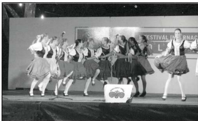
«AYFAS» FOLK DANCE GROUP (Cunovo - Eslovàquia)

- When the first classified groups score the same number of points, the prizes in cash will be divided proportionally and the trophies will be given to all those who share the position.