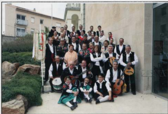
EL SENTIR DE UNA TIERRA (Vilanova del Camí - Catalunya)