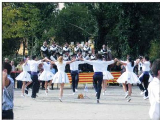
COLLA SARDANISTA VIOLETES DEL BOSC (Barcelona - Catalunya)