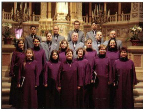
ESTERHAZY CHAMBER CHOIR (Tata - Hongria)