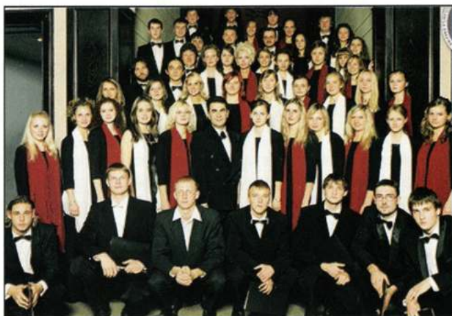
COR DAUGAVA (Daugavpils - Letònia)