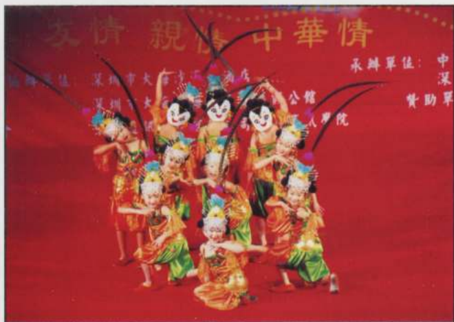
CHORALE ET GROUPE DE DANSE DALIAN (Dalian - Xina)