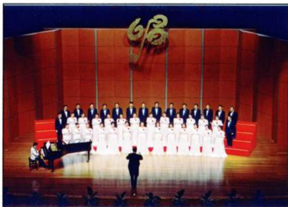
ZHEJIANG CHORUS OF CHINA (Zhejiang - Xina)