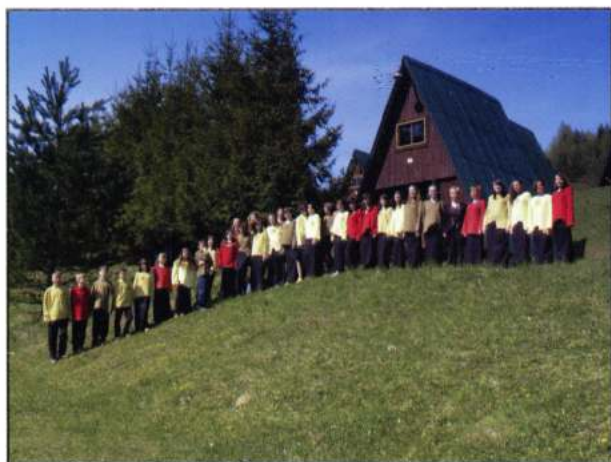
SEPTEMHILLIS (Lipany - Eslovàquia)